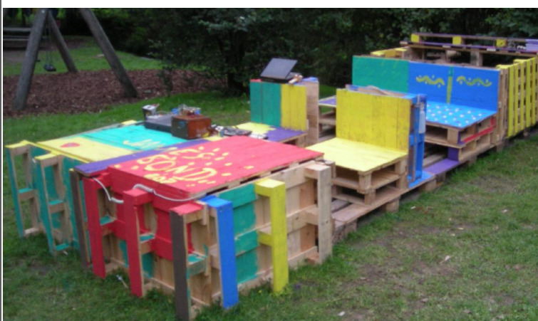
Bondmobil - ein Unikat mit allem Schnickschnack Mit diesem Agentenauto entkommt keiner mehr.